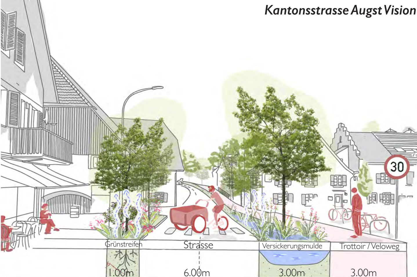
Kantonsstrasse Augst Vision

Neben einem beruhigteren Abschnitt für Autos wird es auch einen breiten und sicheren Weg für Velofahrer:innen und Fussgänger:innen geben. Ein Grünstreifen mit vielen Pflanzen, Bäumen und Wasser sorgt dafür, dass es hier auch an heissen Sommertagen angenehm ist. Hier kann Regenwasser aufgefangen, Schatten gespendet und der vorhandene Raum zukunftsfähig und ökologisch gestaltet werden. Begleitet uns doch zu eurer neuen Ortsdurchfahrt, ihr werdet stolz darauf sein!